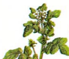
Cresson de Fontaine