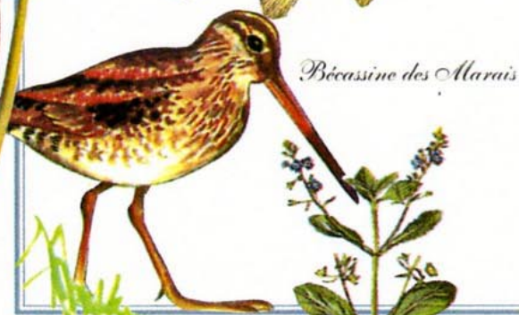
Bécassine des Marais