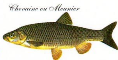
Chevenne ou Moineau