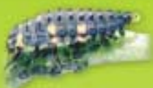
Larve de coccinelle

Apprenez à reconnaître ces auxiliaires et notamment, les insectes suivants qui seront des alliés très précieux :