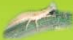
Larve de chrysope